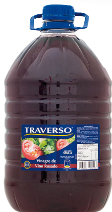
CÓDIGO 374 VINAGRE VINO RDO TRAVERSO 5LT X1 UND X CAJA 4 UND MÍNIMA DE VENTA 1 PRECIO UND MIN. DE VENTA $ 2.799 PRECIO UNIDAD $ 2.799