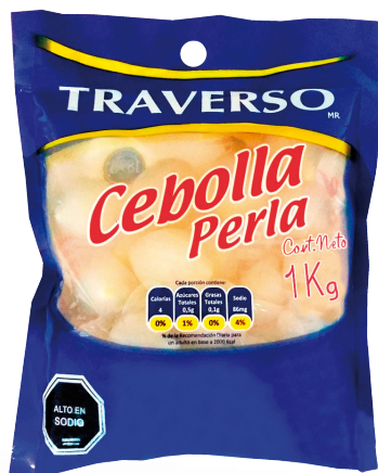
CÓDIGO 379 CEBOLLA PERLA TRAVERSO 1K X1 UND X CAJA 6 UND MÍNIMA DE VENTA 1 PRECIO UND MIN. DE VENTA $ 3.225 PRECIO UNIDAD $ 3.225