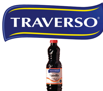
CÓDIGO 381 VAINILLA PET TRAVERSO 250CC X6 UND X CAJA 6 UND MÍNIMA DE VENTA 6 PRECIO UND MIN. DE VENTA $ 4.068 PRECIO UNIDAD $ 678