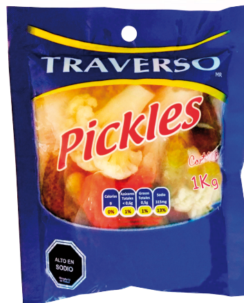
CÓDIGO 378 PICKLES TRAVERSO BOLSA 1K X1 UND X CAJA 6 UND MÍNIMA DE VENTA 1 PRECIO UND MIN. DE VENTA $ 2.414 PRECIO UNIDAD $ 2.414